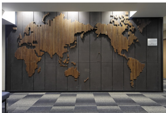
木製地図(旧建物5階から移設したもの)